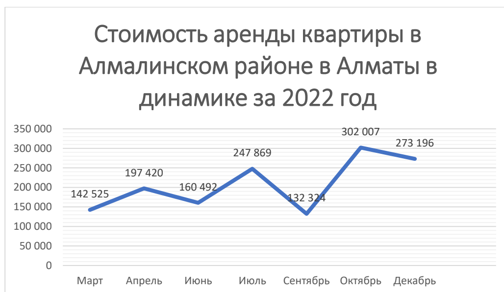
Рисунок 2 – Стоимость аренды квартиры в Алмалинском районе в Алматы в динамике за 2022 г [3].

Высокие цены объясняются расположением. Район охватывает старый центр города — «золотой квадрат», где стоимость аренды даже в обычных домах соответствует уровню типичных ЖК 2-го класса комфортности [2].